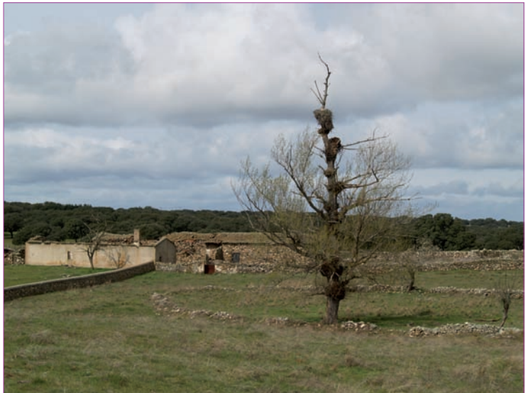
Finca “La Torre”

“La Torre”, es el nombre de la finca en la que pastan los machos de la ganadería Barcial, de encaste Vega-Villar. Situada en el municipio salmantino de San Pedro de Rozados, se compone de 550 hectáreas, de las cuales unas 100 se destinan a forraje. Las hembras de este hierro se encuentran en “La Matilla”, finca situada en el término municipal de Beleña. Ambas son dehesas fundamentalmente de encina.